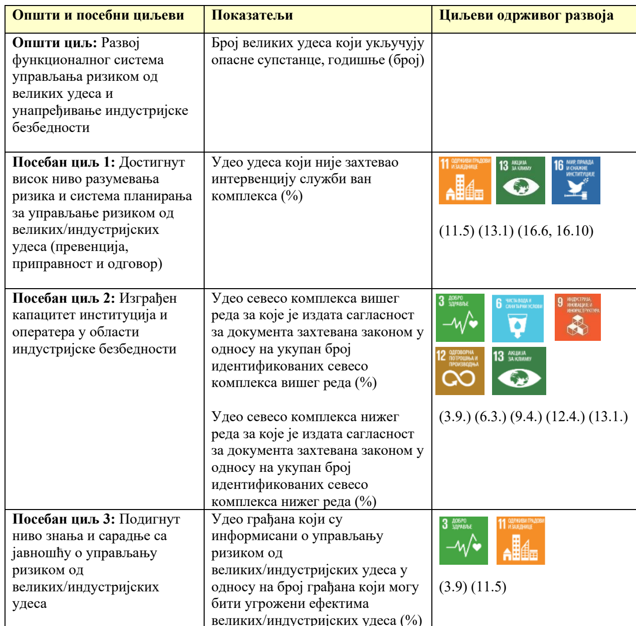
Табела 6.2. Преглед доприноса циљева Програма циљевима одрживог развоја Агенде 2030

Спровођење Агенде 2030 и остваривање изабраних Циљева одрживог развоја (ЦОР 3, 6, 9, 11, 12, 13 и 16) у директној је вези и са испуњавањем четири приоритетне области Оквира за смањење ризика од катастрофа из Сендаја за период 2015-2030. године, јер обе агенде промовишу отпорност, одрживост, добробит становништва и јачање институционалних капацитета за управљање ризицима.